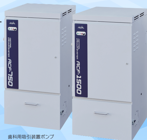
歯科用吸引装置ポンプ セントラルバキューム ACF-750 認証番号/304AGBZX00053000