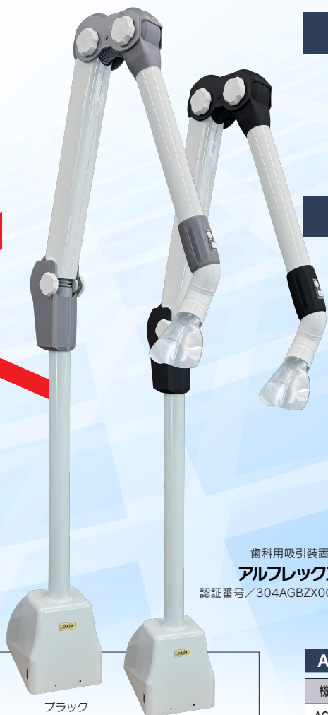
歯科用吸引装置 アルフレックス 認証番号/304AGBZX00088000